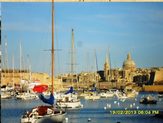
гледка към крепостите